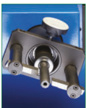
SKIVING MANDREL MANDRINO SPELLATURA