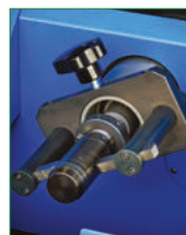
SKIVING MANDREL MANDRINO SPELLATURA