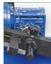
SKIVING MANDREL MANDRINO SPELLATURA