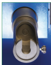
INSERT MANDREL MANDRINO INSERITORE