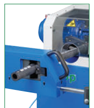
PNEUMO-HYDRAULIC VICE OPTIONAL MORSA PNEUMO-IDRAULICA OPTIONAL