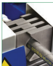
SELF-CENTERING PNEUMATIC VICE MORSA PNEUMATICA AUTOCENTRANTE